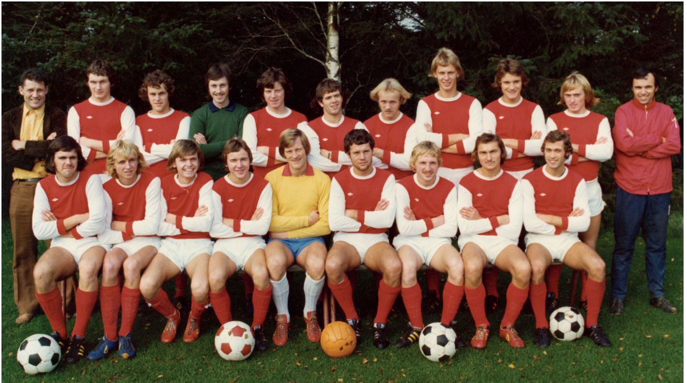
Brynes A-lagstropp i jubelsesongen 1975.